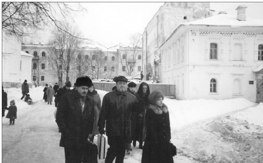
Конференция «Колокола. История и современность». Новгород. Январь 1999